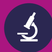
Biologie of mens & natuur