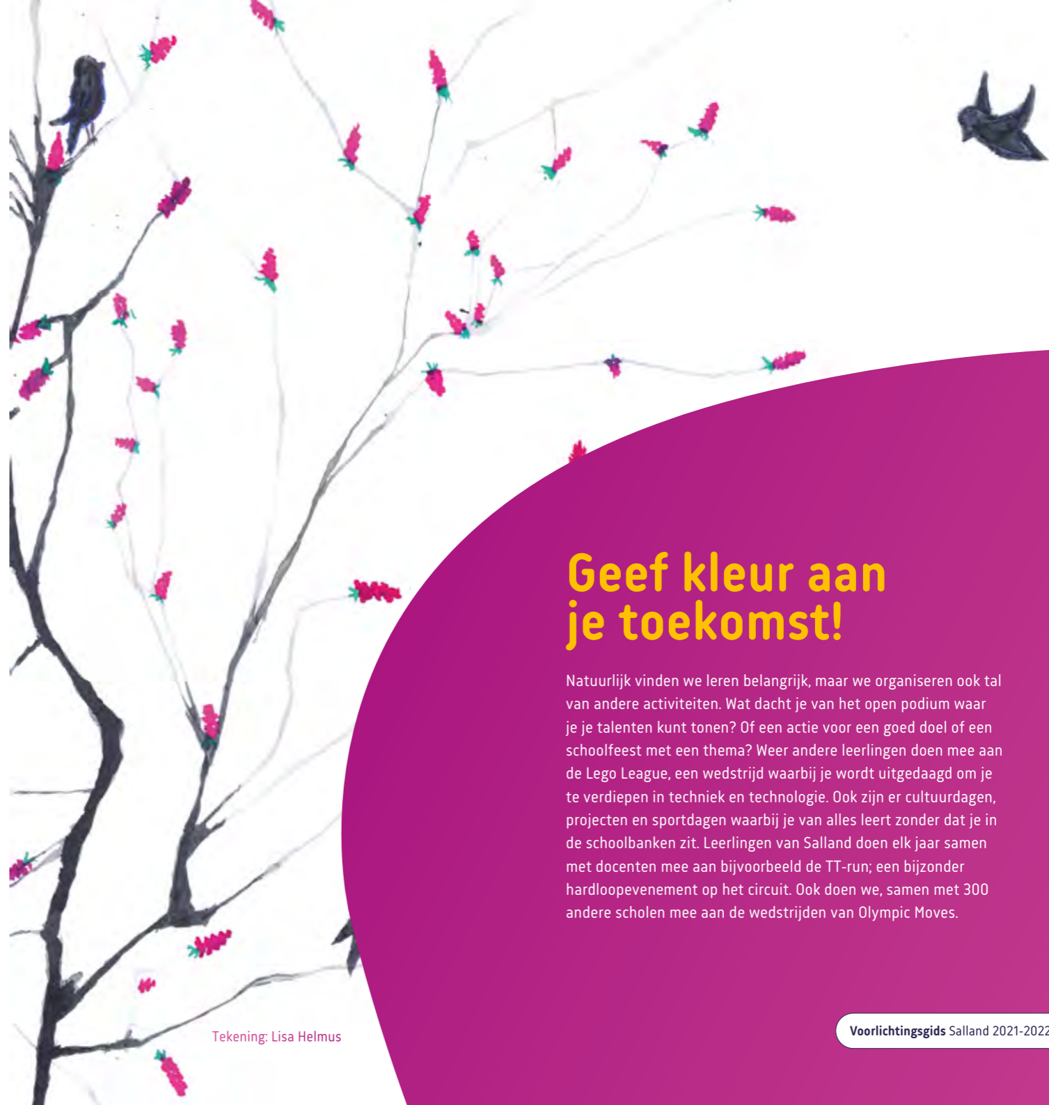
Tekening: Lisa Helmus